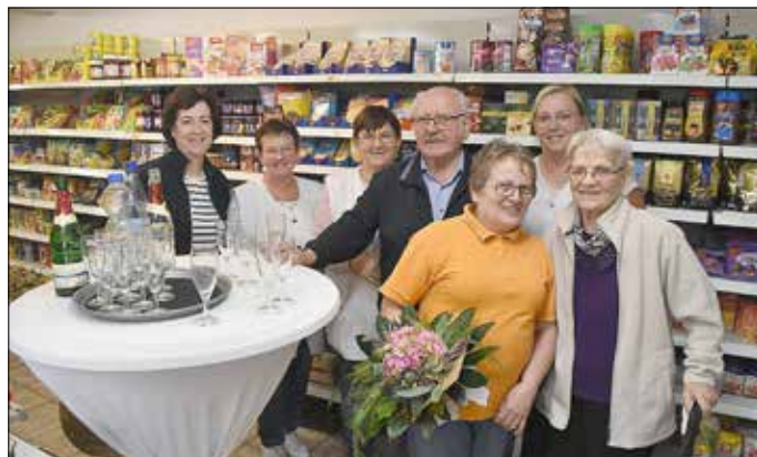
Viele Kunden bedankten sich beim Team des Faulunger Dorfladens.

Das Klischee „Tante-Emma-Laden“ traf für die beiden Geschäfte in Faulungen und Großbartloff mit jeweils weit über 2000 verschiedenen Artikeln und anderen Serviceleistungen nicht unbedingt zu. Vor allem etablierten sie sich zu wichtigen Orten der Kommunikation und der dörflichen Gemeinschaft. In Faulungen fehlt nun ein beliebter Treff im Einkaufsmarkt oder Getränkemarkt.