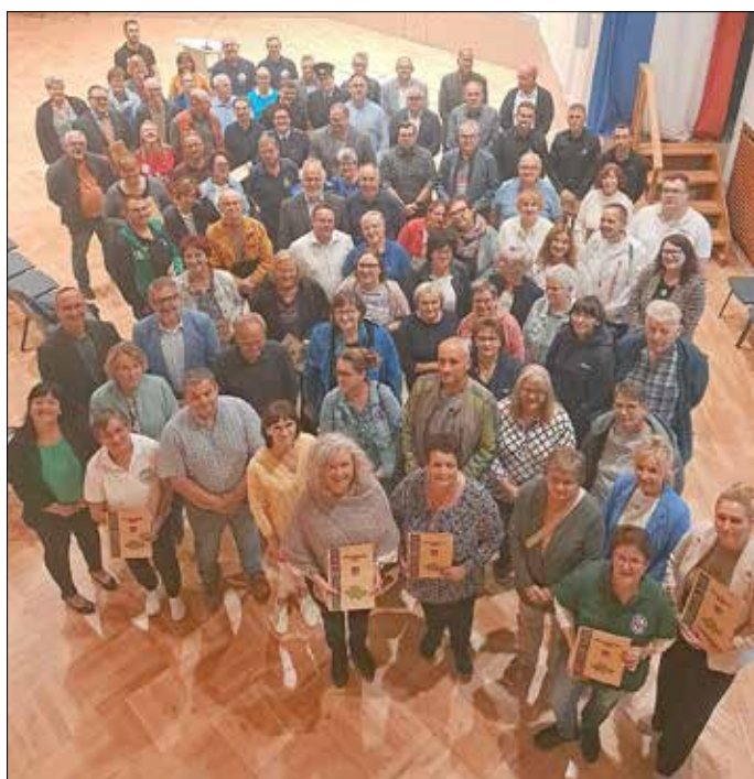
Text und Fotos: Jessica Döring Ehrenamtsbeauftragte/Büro Landrat