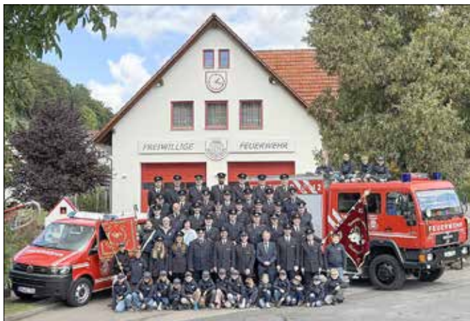
Gruppenfoto zum Jubiläum mit den Kameradinnen und Kameraden der Feuerwehr Wendehausen

Zum Ende dieser Jubiläumsfeierlichkeiten bleibt vor allem eines: Dankbarkeit. Dank an all jene, die mit ihrem Engagement, ihrer Zeit und ihrer Unterstützung zum Gelingen dieser besonderen Woche beigetragen haben. Ob als Helferinnen und Helfer im Hintergrund, als aktive Mitwirkende, als Vereinsvertreterinnen und Vereinsvertreter oder einfach als Gäste - sie alle haben dazu beigetragen, dass das 100-jährige Jubiläum der Feuerwehr Wendehausen zu einem unvergesslichen Erlebnis wurde. Die Feuerwehr blickt stolz zurück - und voller Zuversicht nach vorn, auf viele weitere Jahre gelebter Kameradschaft, Einsatzbereitschaft und Gemeinschaftssinn.