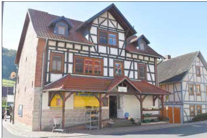
Auch äußerlich wurde das traditionsreiche Geschäft zu einem Blickfang in Faulungen.