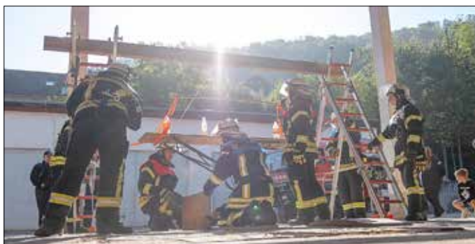
Einblick aus der 2. Übung beim Kreisausscheid