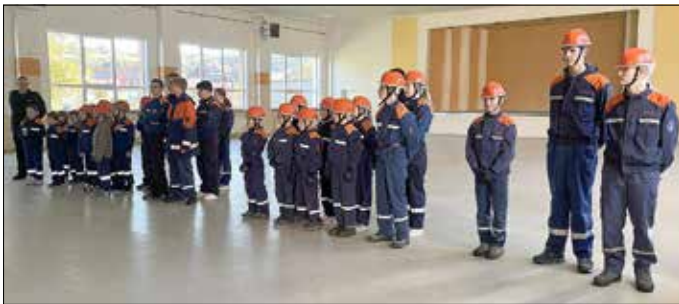
Kinder und Jugendliche der Jugendfeuerwehren am Prüfungstag zur Begrüßung

Für alle Teilnehmenden war es ein ereignisreicher, spannender und erfolgreicher Tag. Jedes Kind und jeder Jugendliche konnte am Ende stolz sein Abzeichen entgegennehmen - ein verdienter Lohn für den Einsatz, die Übungsbereitschaft und den Teamgeist, den sie das ganze Jahr über in der Jugendfeuerwehr zeigen. Ein herzlicher Dank geht an die Kreisjugendfeuerwehr sowie an die Feuerwehr Diedorf für die Organisation und Ausrichtung dieses gelungenen Prüfungstages. Es war ein schöner Beweis dafür, dass die Nachwuchsarbeit in unseren Jugendfeuerwehren auf einem starken Fundament steht - mit viel Engagement, Freude und einer großen Portion Teamgeist.