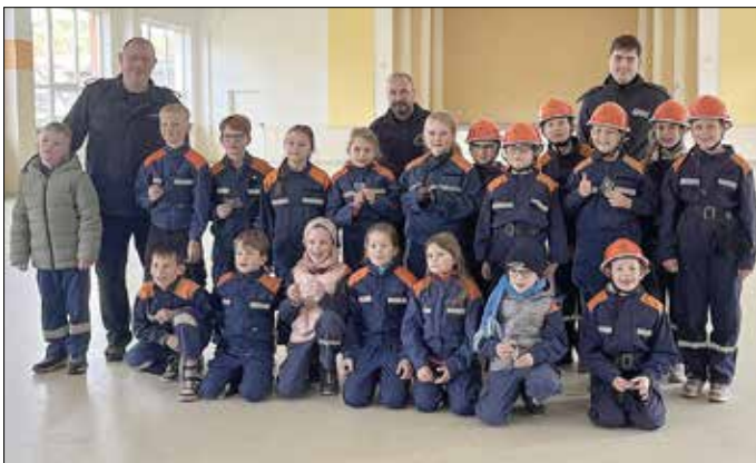
Kinder mit den Leistungsabzeichen Silber und Gold