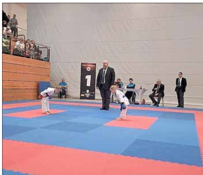
Der Heimatverein